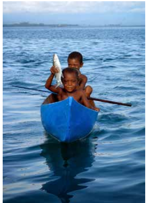
Damit Kinder lernen können, anstatt zu hungern.

Ernährungssicherheit bedeutet: Menschen sind nicht länger der nächsten Krise ausgeliefert. Wer ausreichend und gesund essen kann, wird widerstandsfähiger gegen Krankheiten, Kinder können konzentrierter lernen, und Familien gewinnen neue Kraft, ihren Alltag aus eigener Hand zu gestalten. Genau hier setzt unsere Hilfe an: Sie verbindet das Teilen im Heute mit einem Weg in die Selbstständigkeit von morgen.